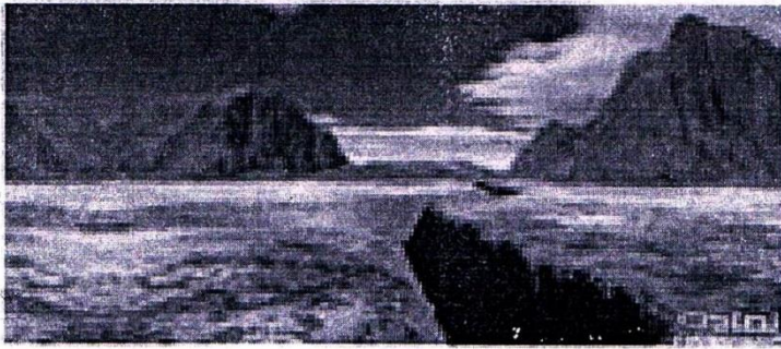
المدى 3: باقى صفاق في طور التشكل شرق إفريقيا

الوثيقة 3: تشكل الظهرة المحيطية: يعتبر صعود الماغما على مستوى القسم العلوي للرداء السبب المباشر في النشاط البركاني الكبير (البركانية البحرية) الموجود على مستوى الظهرة. يؤدي تدفق الحمم البازلتية على مستوى ريفت الظهرة إلى تشكل قشرة محيطية جديدة تدفع القشرة المحيطية الأقدم منها لتشكل أرضية محيطية ذات طبقات بازلتية مختلفة الأعمار.