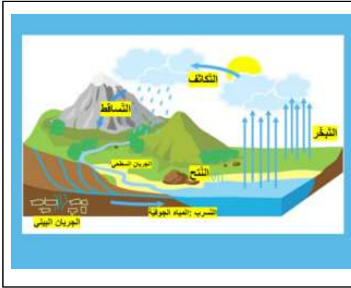
الوثيقة (01): دورة المياه في الطبيعة