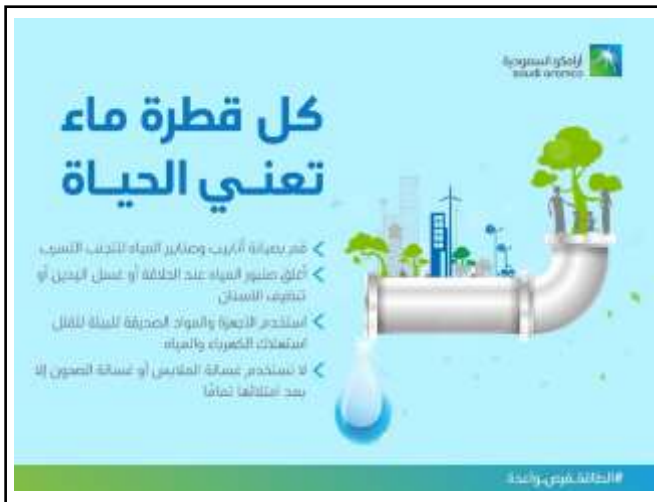
الوثيقة (03): المحافظة على المياه

(3) أعط نصيحتين للمحافظة على المياه في الطبيعة.