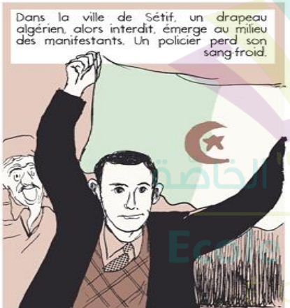
Dans la ville de Sétif, un drapeau algérien, alors interdit, émerge au milieu des manifestants. Un policier perd son sang froid.