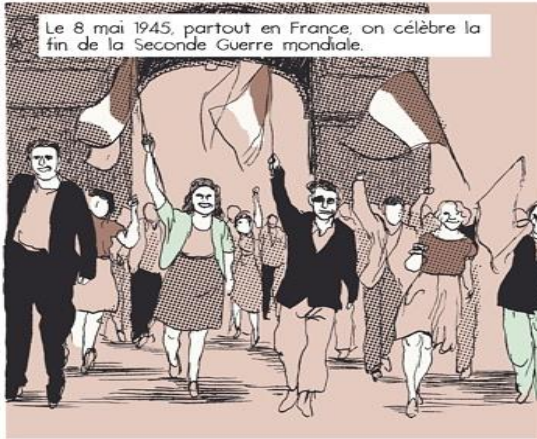
Le 8 mai 1945, partout en France, on célèbre la fin de la Seconde Guerre mondiale.