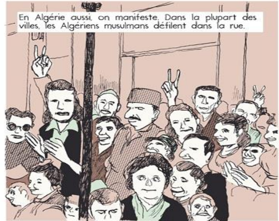
En Algérie aussi, on manifeste. Dans la plupart des villes, les Algériens musulmans défilent dans la rue.