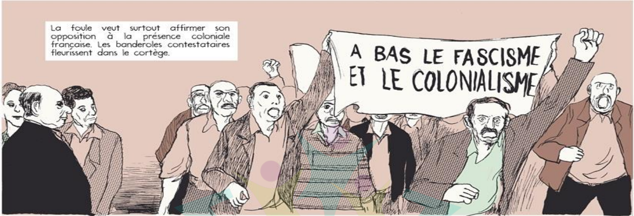
La foule veut surtout affirmer son opposition à la présence coloniale française. Les banderoles contestataires fleurissent dans le cortège.