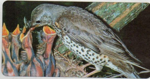
طائر السمان وصغاره