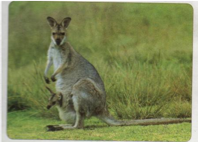
أنثى الكنغر مزودة بجراب بطني تحمل أربع حلمات يمكث صغيرها في جراب أمه