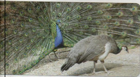
الطاووس الأزرق في رحلة زفاف