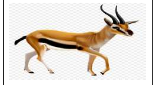
صورة لغزال الدوركاس