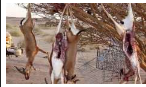
الصيد في الصحراء الجزائرية

تعيش الجزائر أزمة حقيقية في تنوعها البيولوجي تهدد بفقدان أكثر من نصف ثرواتها الحيوانية و النباتية وهذه الأزمة في تزايد مستمر ما لم تتخذ الدولة جميع الإجراءات الوقائية اللازمة للحد من هذه الأزمة في فقدان الأنواع الحيوانية و النباتية إذ تعتبر بعض الأنواع كشجرة العرعار و غزال الدوركاس من أكثر الأنواع المهددة بالإنقراض في الجزائر .