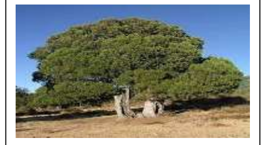
صورة لشجرة العرعار النادر