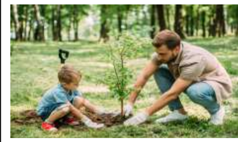
بعض النشاطات التي تساهم في الإعمار النباتي