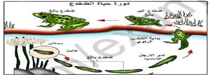
السند رقم 1