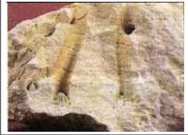
الوثيقة 02: جزء من مستحاثات المرجان الموجودة في بشار

أثناء أشغال البناء العمراني في منطقة بشار صادف العمال وجود بعض الارصفة المرجانية المتحجرة ، قدر علماء المستحاثات عمرها بألاف السنين .