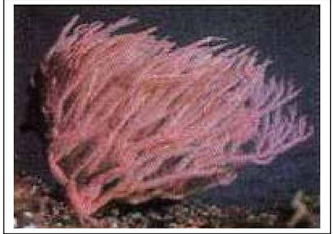
الوثيقة 01: مرجان حالي