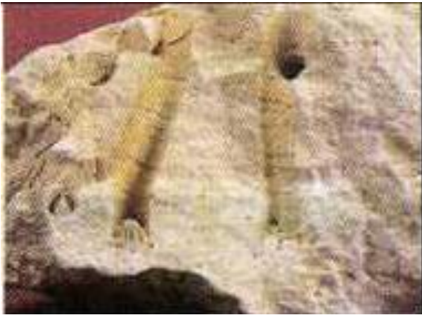
الوثيقة 02: جزء من مستحاثة المرجان

أثناء أشغال البناء العمراني صادف العمال وجود بعض الارصفة المرجانية المتحجرة، قدر علماء المستحاثات عمرها بألاف السنين.