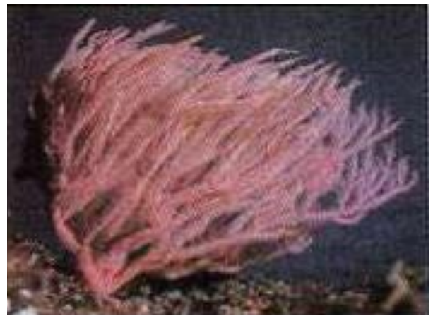
الوثيقة 01: مرجان حالي