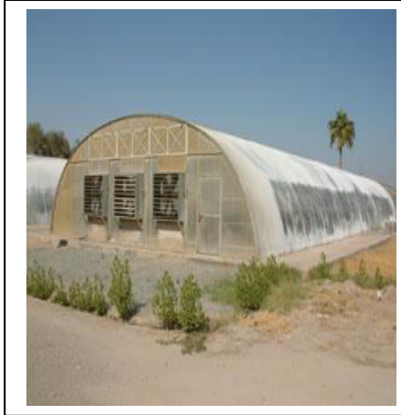
الوثيقة - 2 -