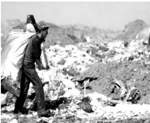
مكان إفراغ النفايات (مزبلة)