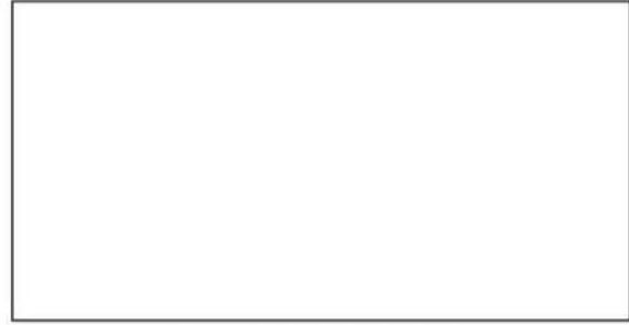
المخطط النظامي لتركيب خالد

2- أذكر طريقة توصيل المصابيح في كل تركيب.