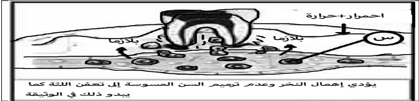
الوثيقة 1: حالة ضرس أخ سناء

الوضعية الأولى: (10ن) لسناء أخ صغير لا يحرص على نظافة أسنانه ولا ينتبه لغذائه، وذات يوم جاء يشتهي من ألم في ضرسه وانبعث رائحة كريهة من فمه وانتفاخ في الخد الموافق للضرس المصابة مع ارتفاع في درجة حرارته.