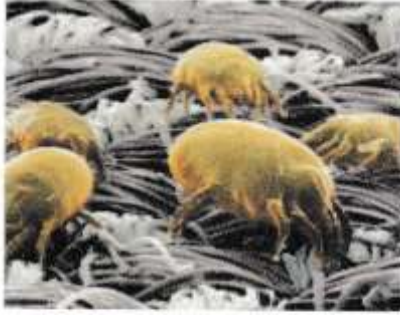
الوثيقة 3 أحد مسببات الحساسية

إن النظام المناعي موجه طبيعيا نحو إبطال مفعول الأجسام الغريبة ( مولدات الضد ) المضرة وتخليص العضوية منها بفضل آليات الدفاع المناسبة، إلا أنه في بعض الحالات يحدث أن هذه مولدات الضد (الغبار، القراديات، السمك، الفراولة، حبوب الطلع وغيرها) التي لا تكون في الأصل ضارة ويتقبلها النظام المناعي فتصبح سببا لاضطرابات في عمل العضوية عند بعض الأشخاص .