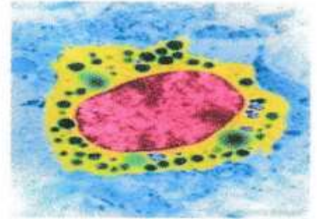
الوثيقة 4 خلية الماستوسيت في حالة راحة

إعتادا على السياق والوثائق ومكتسباتك القبلية أجب عن التعليمات التالية :