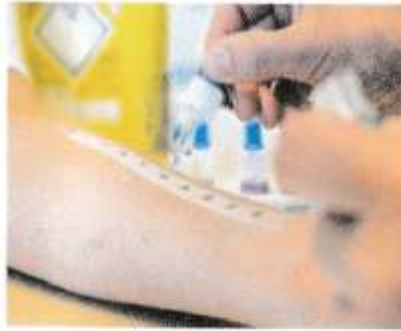
الوثيقة 2 إختبارات جلدية