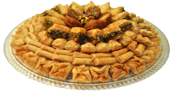
الوثيقة 03 : طبق من الحلويات الشرقية .

معتمدا على السندات المقدمة و مكتسباتك ، أجب عن التعليمات التالية :